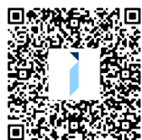
保單暫託人 服務單張